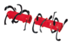
Juego de cilindros hexagonales