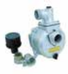
Bomba de agua

Aplica solo para motozadas ref. DTL10000-11000-13000