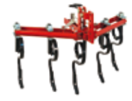
Cultivador extensible 5 brazos flexibles