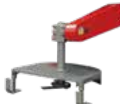
Cortamaleza *Solo aplica para DTL9000

Aplica solo para motozadas ref. DTL10000-11000-13000