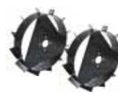
Juego de ruedas metálicas