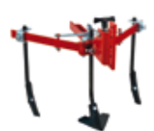
Cultivador extensible 3 brazos rígidos