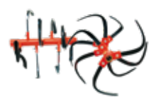
Juego de cuchillas alta profundidad