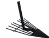
Arranca patatas pro y barra de ajuste